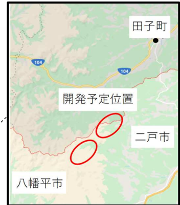
(3) 稲庭田子風力発電事業