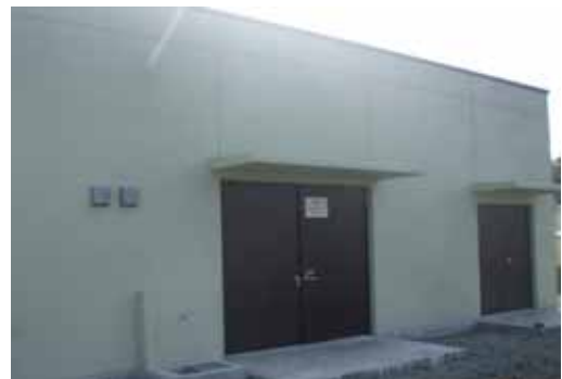
（2号機放水口モニター設備設置建屋）