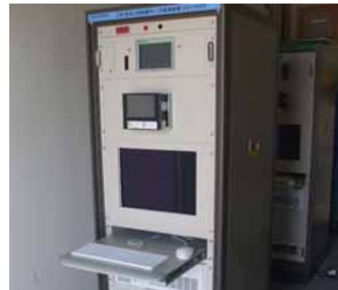
（測定設備およびデータ伝送設備）