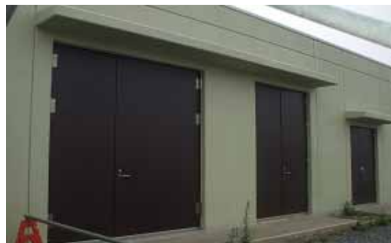
(3号機放水口モニター設備設置建屋)