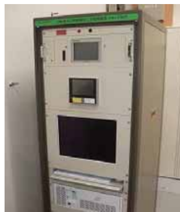
(測定設備およびデータ伝送設備)