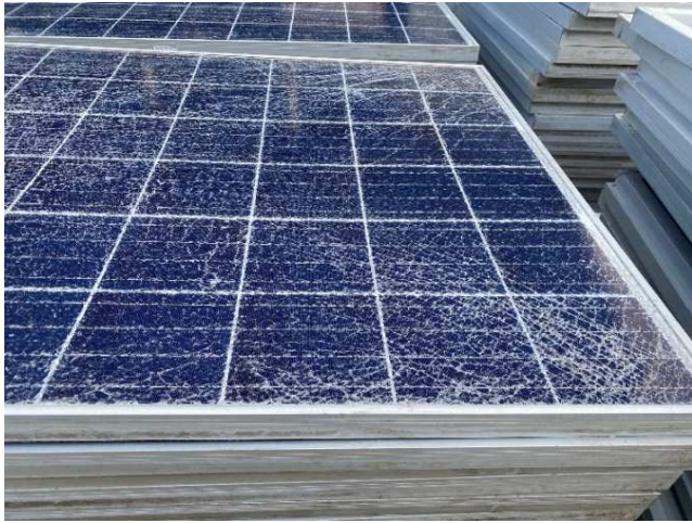
回収された太陽光パネル