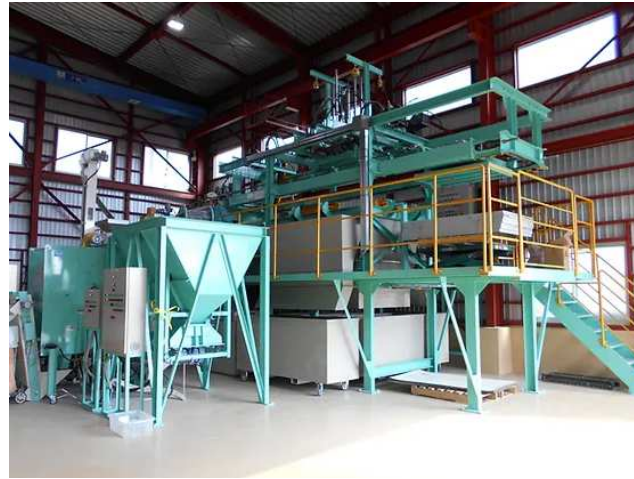
太陽光パネル・リサイクルシステム