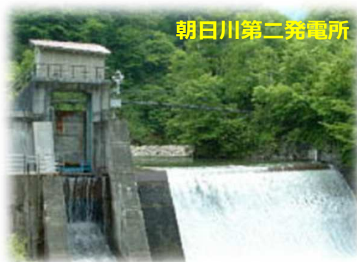
朝日川第二発電所