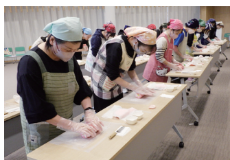
べこもち教室 (2025年12月7日)