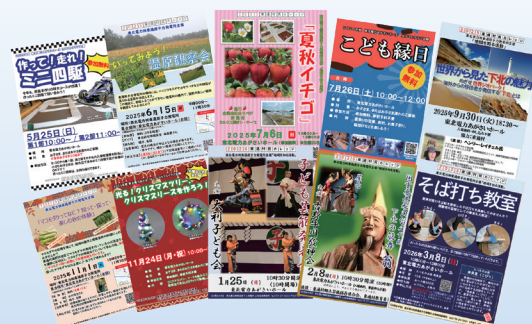
2025年度も、当社主催のイベントを 数多く開催しました