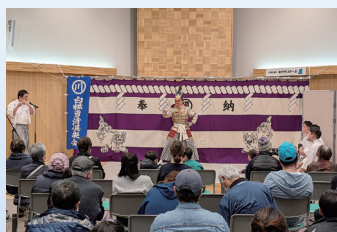
あがさいホール 4周年記念イベント (2026年3月22日)