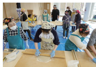
そば打ち教室 (2026年3月8日)