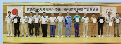
発電所を支えていただいた構内協力企業の 皆さまに感謝状を贈呈しました (2026年5月)

引き続き、安全確保を最優先に、一つひとつのプロセスにしっかりと対応するとともに、地域の皆さまに当社の取り組みを丁寧にお伝えしながら、発電所で働く全従業員が一丸となって再稼働に向けて全力で取り組んでまいります。