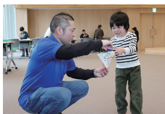
空へとばそう！ スカイスクリュ、フライングカイト (2026年4月18日)