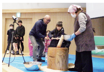
大もちつき大会 (2026年1月24日)