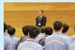
樋口会長から発電所員への訓示 (3月12日)

発電所の取り組み状況について、引き続き、さまざまな機会を通じて丁寧にお伝えし、地域の皆さまからの信頼回復に努めてまいります。