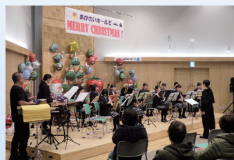
あがさいホールで メリークリスマス！ (2025年12月21日)