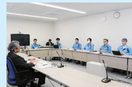
石山社長と核物質防護課員との対話 (4月23日)

根本原因分析の結果や改善措置活動の計画は、改善措置報告書として取りまとめ、当社ホームページにて公開しております→