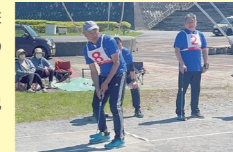
東通村春季ゲートボール大会

5月17日(日)に開催された「東通村春季ゲートボール大会」に所員5名、「よこはま菜の花マラソン大会」に所員10名が参加しました。 初夏の爽やかな風と日差しを浴びながら、地域の皆さまと一緒に汗を流して、交流を深めました。