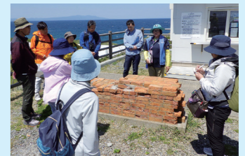
レンガ造りの灯台として日本一の高さを誇る尻屋崎灯台を見学しました