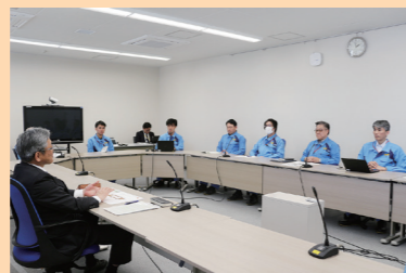
核物質防護課員との対話の様子

また、所員への訓示も実施し、一人ひとりが本事案をしっかりと受け止めることの大切さや、声を掛け合える職場づくりの重要性などを述べました。