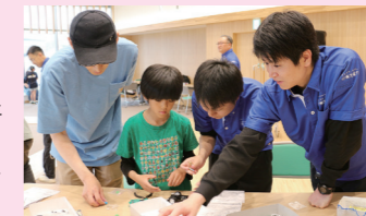
スタッフがミニ四駆の組み立てをサポートします

5月30日(土)、あがさいホールにおいて、「作って!走れ!ミニ四駆」を開催しました。 参加者は、自分で組み立てたミニ四駆を、所員手作りの特大コースで走らせました。会場には多くの参加者が訪れ、賑やかな雰囲気になりました。