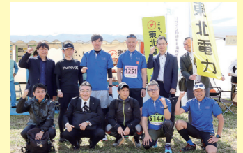
よこはま菜の花マラソン大会