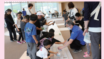
勢いよく駆け抜けるミニ四駆に夢中になっていました