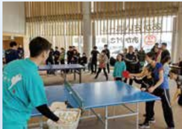
カラフルクラブ ひがしどおり卓球教室 (3月17日)

2022年3月に開設した「東北電力 あがさいホール」では、今後も「賑わい」と「交流」の場として、地域の皆さまと一体となったイベントを年間を通じて開催してまいります。