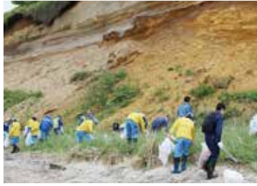
北部海岸清掃 (5月21日)