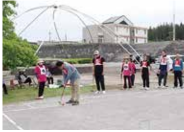
春季ゲートボール大会 (5月12日)