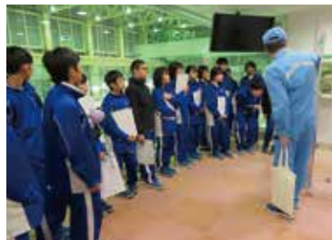
東通中学校1年生 東通原子力発電所見学 (10月22日)