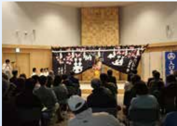
あがさいホール2周年記念イベント 東通の郷土芸能と食を楽しむ会 (3月31日)