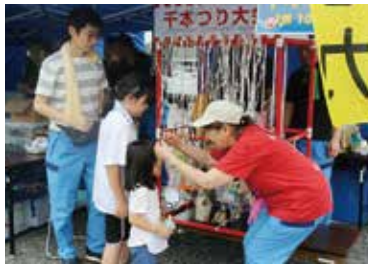
東通ドン!とボン・盆フェスタ (8月14日)