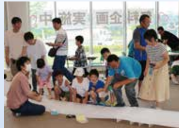
カラフルクラブ ミニ四駆であそぼう！ (6月30日)