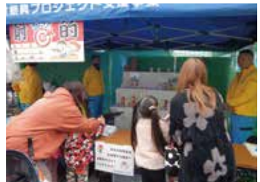
東通村 産業まつり (11月3日)