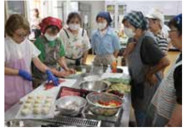
東通村産品を使った料理教室 (7月16日)