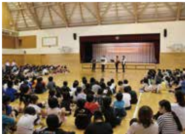
東通小学校 スクールコンサート (9月18日)