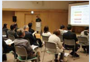
2024東通村民カレッジ 地域を知る活動 北部海岸編 (9月25日)

これからも地域の皆さまから信頼される発電所を目指し、発電所および協力会社が一丸となって、より一層の安全性向上に努めるとともに、所員一人ひとりが東通村のさらなる発展に貢献できるよう行動してまいります。