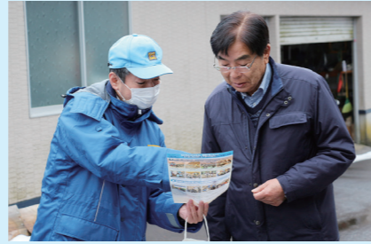
発電所の状況をお知らせ

今後も、発電所の状況や再稼働に向けた取り組みなどについて、わかりやすくお知らせしてまいります。