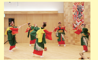
老部婦人会の皆さんによる優美な「田植えもちつき踊り」