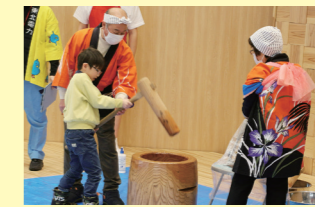
餅つき体験。杵の重さにびっくり!