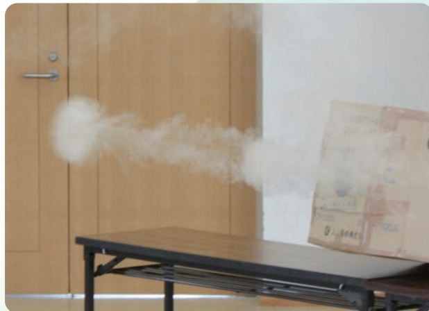
空気砲 ※写真はイメージです。