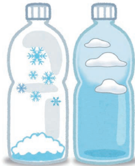
※イラストはイメージです。

空に浮かぶ雲や寒い冬の日に降る雪が、どのようにしてできているのか不思議に思ったことはありませんか? 今回は、雲と雪が発生する仕組みを学びながら、ペットボトルの中に雲や雪の結晶を作る実験に挑戦します。 みんなで雲と雪の不思議を探ってみよう!