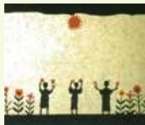
活動の一つ 「おてんとさん影絵」の一場面

大正10年に日本初の童謡専門誌『おてんとさん』が発行されると、それに感動した教師や若者たちが、全国でも珍しい童謡中心の児童運動を展開し、戦前から戦後にかけ継承されてきました。100年の歴史を刻んだ、その歩みをパネル展と資料展で解説します。