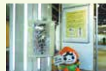
「世界人権宣言」パネル展示の様子

6月1日「人権擁護委員の日」に合わせ、芸術作品として昇華された書画「世界人権宣言」や「ハンセン病」の啓発パネルを展示します。また、過去の宮城県内中学生の人権作文最優秀作品のうち数品を展示します。ぜひ、皆さまのご来場をお待ちしております。