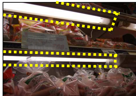
ショーケース棚板照明