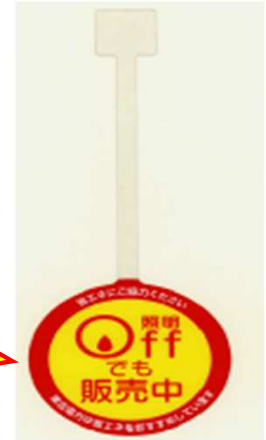
自販機照明消灯中での販売活動事例