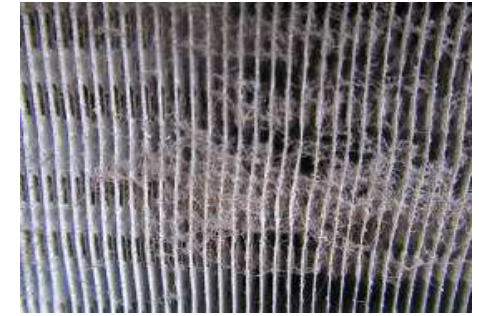
エアコン室外機の裏側の空気吸い込みフィン