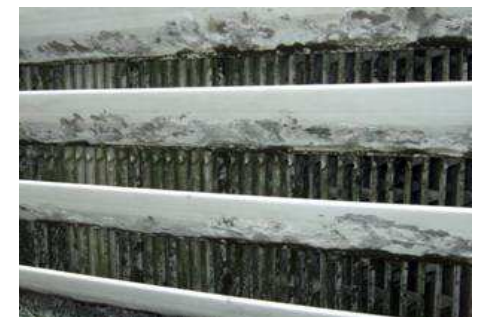
冷却塔充填材の汚れ