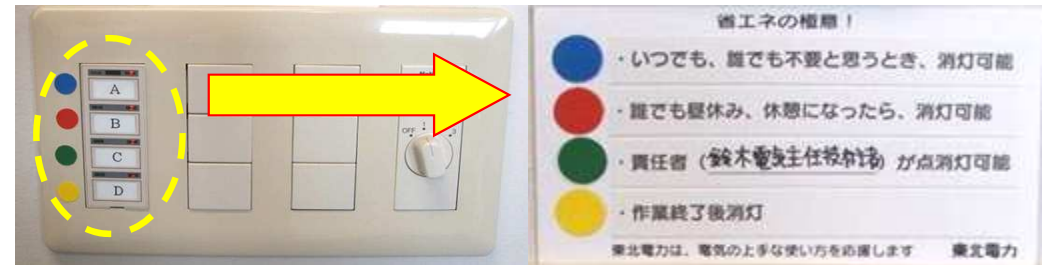
照明スイッチ色分けシール