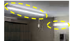
従業員不在時での照明点灯事例