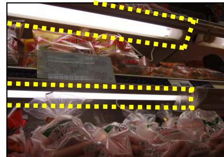
ショーケース棚板照明