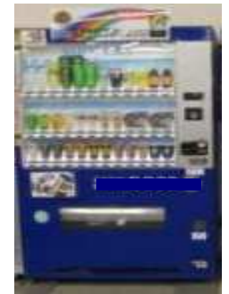
自販機照明の消灯事例