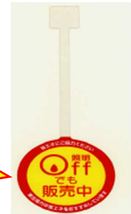
自販機照明消灯中での販売活動事例