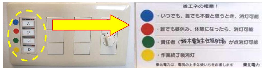
照明スイッチ色分けシール