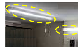
従業員不在時での照明点灯事例