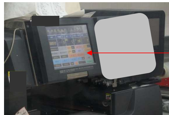
不使用のラベラー電源が「入」