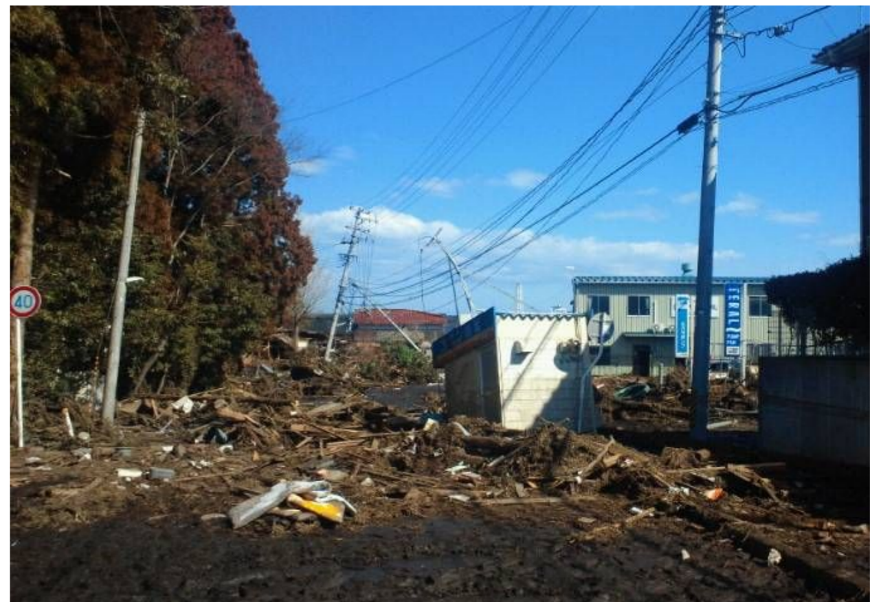
配電設備の被害状況(電柱の倒壊及び傾斜)(福島県南相馬市原町区)