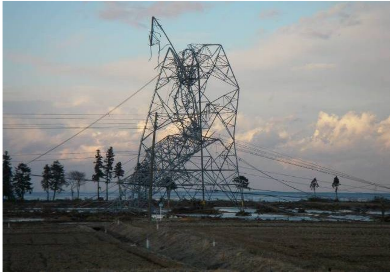
送電鉄塔の折損状況(福島県南相馬市)