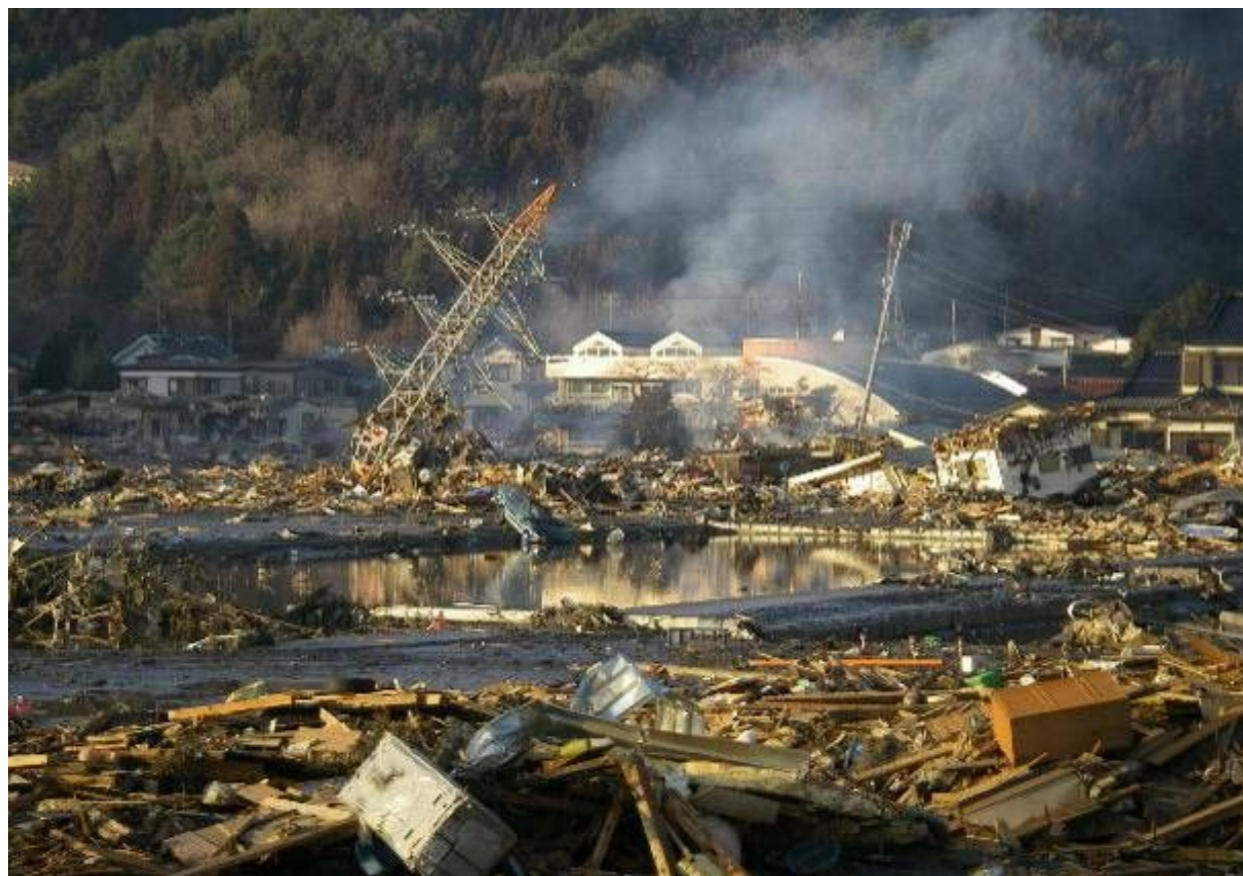
送電設備の地震による設備被害(岩手県大槌町)