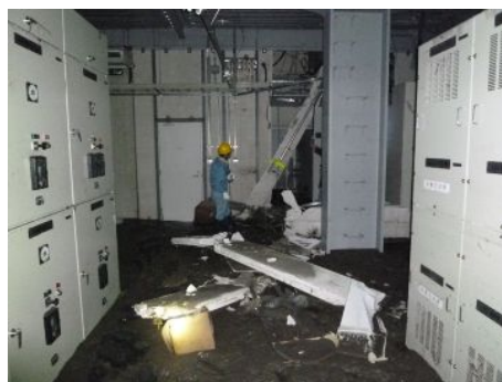
【土砂が流入した電源盤室】