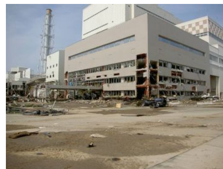
【被災後のサービスビル】