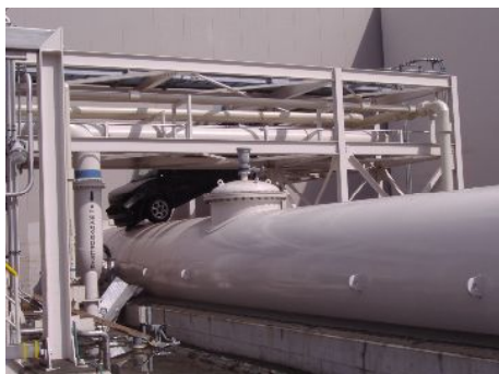
【津波により配管上に押し上げられた車両】