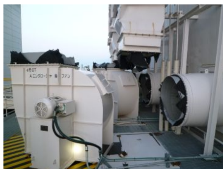
【引きちぎられた設備(ファン)】