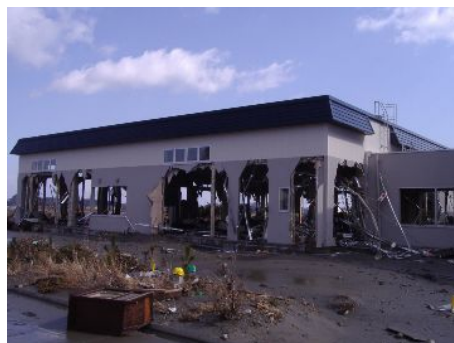
【被災後の火力技術訓練センター(建設中)】