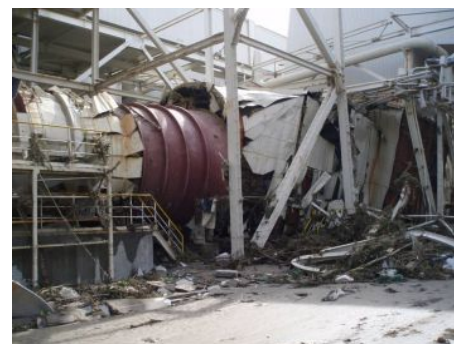
【損壊した大型ファン(誘引通風機)】