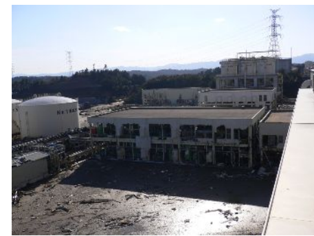
【全壊した給水処理設備】