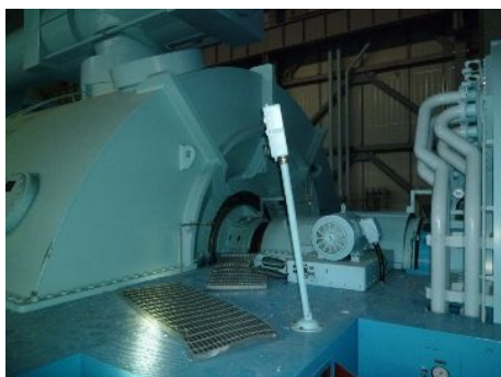
【芯ずれが懸念されるタービン-発電機】