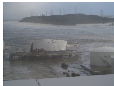
【押しつぶされた燃料タンク】