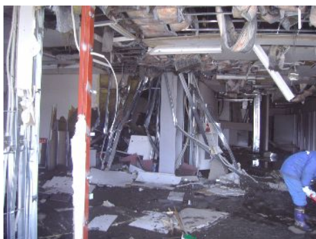
【全冠水し損壊した事務本館1F】