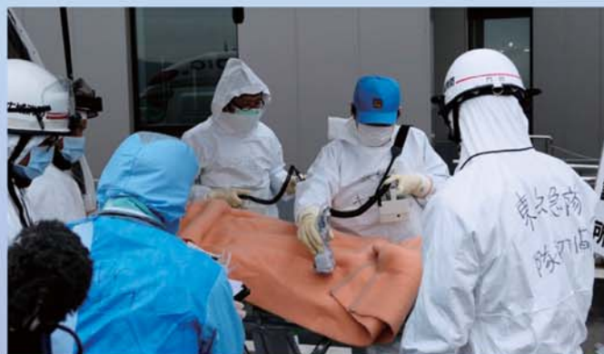
放射線測定器による体表面汚染の検査の様子