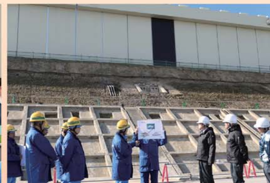
防潮堤での説明の様子