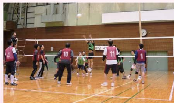
日頃の練習の成果を発揮する選手達

当日は、女川原子力発電所からも2チームが参加し、全10チーム(約100名)による熱戦が繰り広げられました。