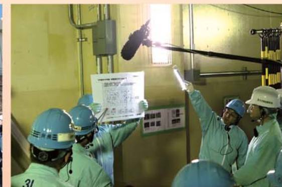
原子炉建屋内での説明の様子