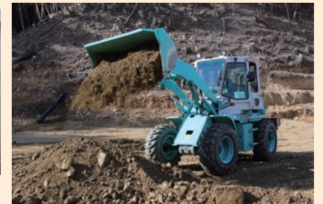
がれきに見立てた土砂の撤去。(がれき撤去訓練)