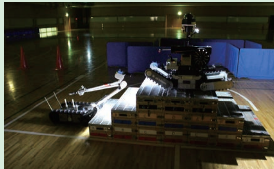
段差などを確認しながら階段を昇降。