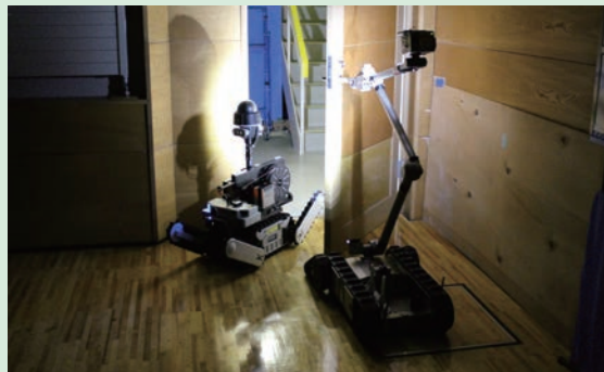
2台のロボットが連携して暗がりの中をドアを開けながら移動。

2月14日(火)・15日(水)、「現場偵察用ロボット」の操作訓練を実施しました。これは、重大事故発生時の放射線量が高い状況において、現場の設備状況や放射線量等を調査するものです。2台のロボットを使用し、ロボットから送信されるカメラ映像を見ながら、遠隔操作により物品のつかみ取りや障害物の回避、計器の読み取りや階段の昇降を行いました。