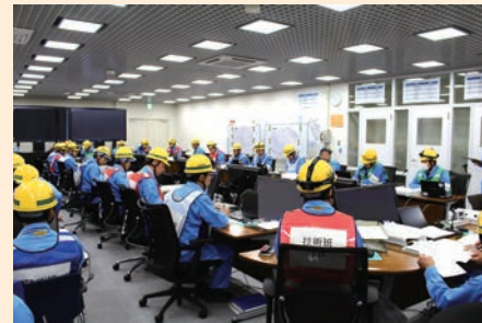
次々と発生する事象に対して的確な指示・伝達を行う。