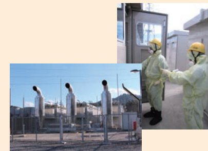
大容量電源装置を用いた電源確保。(起動訓練)