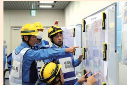
効率的・効果的な復旧戦略の検討を行う。