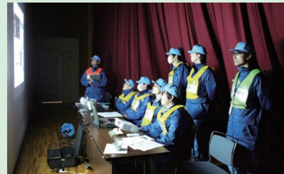
離れた場所から映像を見ながらロボットを操作。

2台のロボットで互いの位置や姿勢を確認しながら、万一の場合に的確な操作ができるように訓練を行いました。