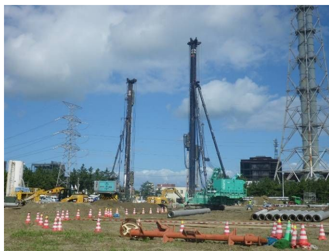
5号機杭打ち工事 (平成23年9月6日撮影)