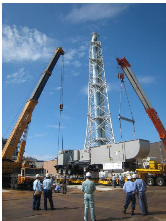
港3号系列据付工事 (平成23年7月31日撮影)